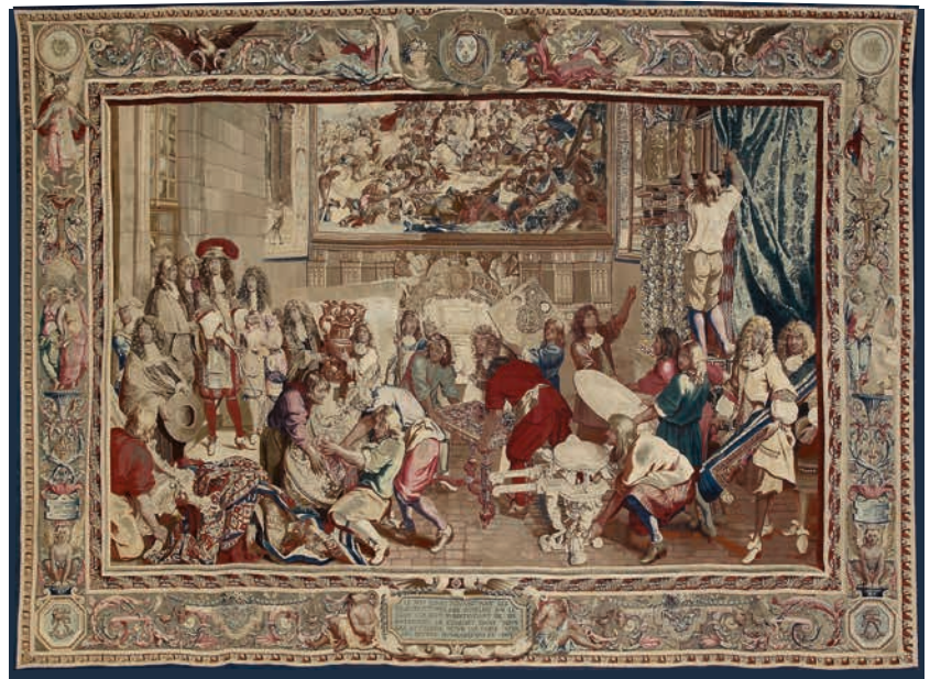
Le Roi visitant la manufacture des Gobelins