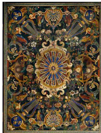
Plateau de table en pierres dures

En 2019, la France fête le quatrième centenaire de la naissance de deux acteurs majeurs de son histoire politique, économique et artistique : Jean-Baptiste Colbert (1619-1683), ministre pendant plus de vingt années du règne de Louis XIV (1661-1683) et de Charles Le Brun (1619-1690), premier peintre du roi.