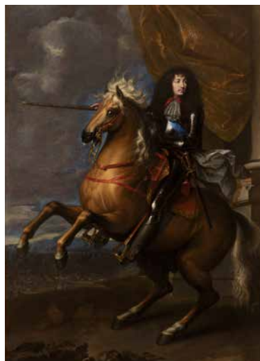
Portrait équestre de Louis XIV